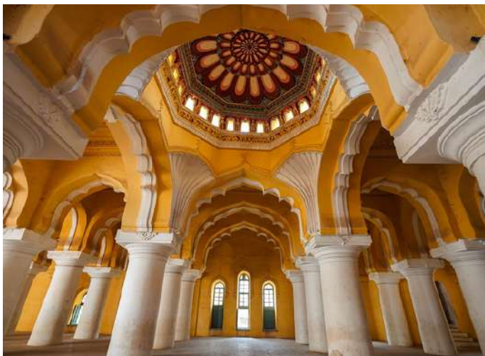
Palacio Tirumala Nayak

Visitaremos el Templo Meenakshi, esta vez con la luz del día.