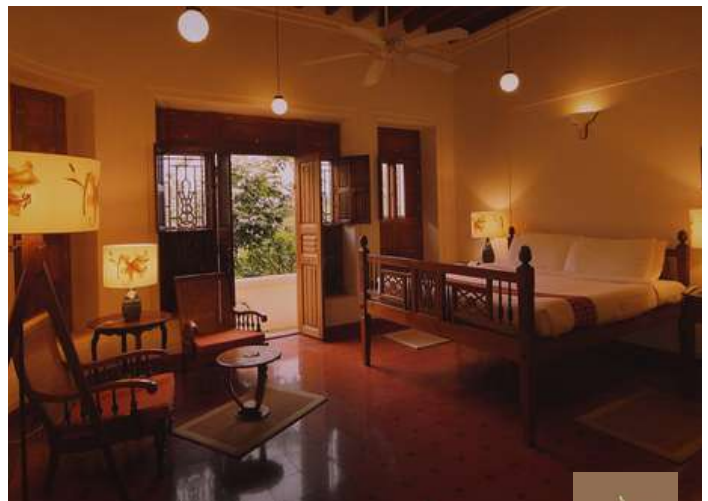
CGH Vilasam, Chettinad