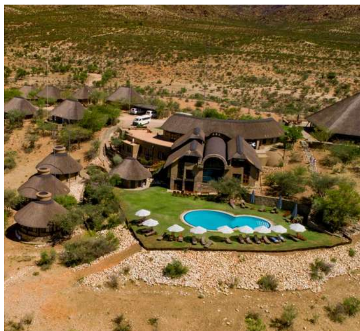
Reserva Natural GocheGanas

Los viajes que presentamos a Namibia son exclusivos de Dinka Travel y no los encontrarás en otros catálogos de viajes en grupo.