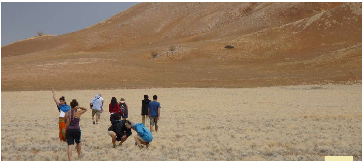
Paisaje de Damaraland