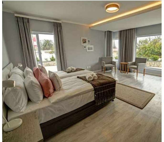
Atlantic Gardens Boutique

Atlantic Gardens Boutique Hotel . Incluido: Desayuno y Snacks.