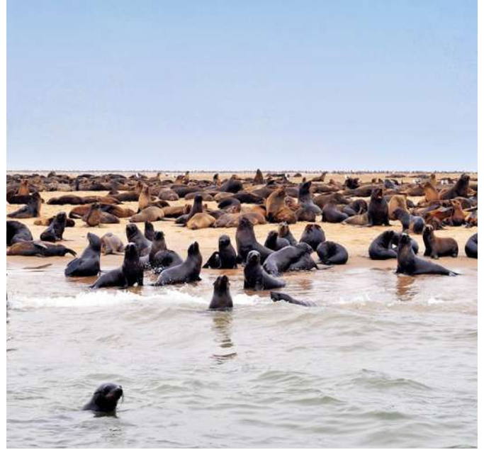
Colonia de Focas del Cabo, Pelican Point

En temporada (julio a noviembre), a menudo se ven mamíferos más grandes como la ballena franca austral y las ballenas jorobadas, mientras que otras especies como la ballena gris y la ballena franca pigmea han hecho apariciones esporádicas. Los delfines nariz de botella se ven regularmente, al igual que los peces luna y las tortugas laúd.