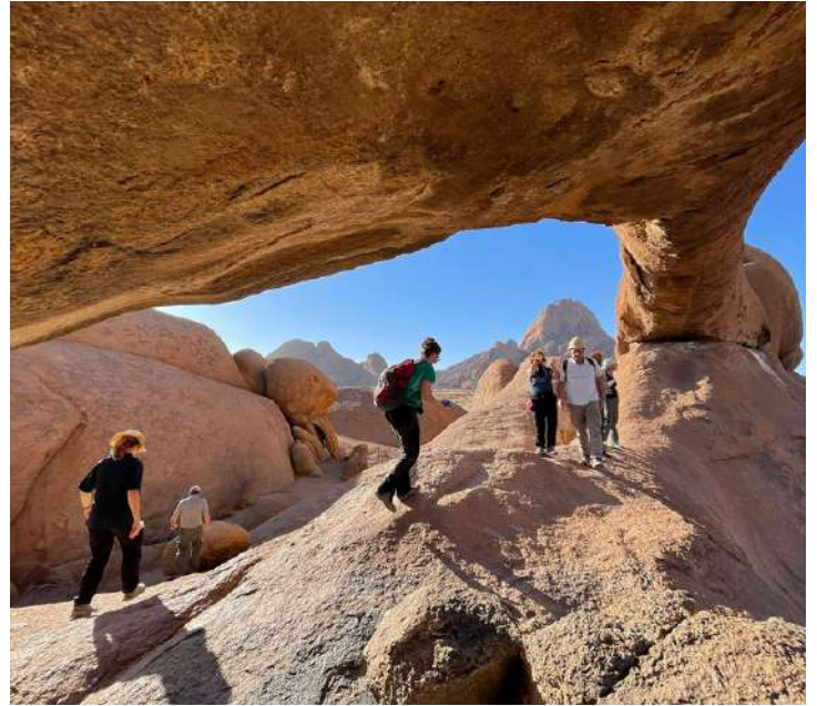
Formaciones Rocosas en Spitzkoppe