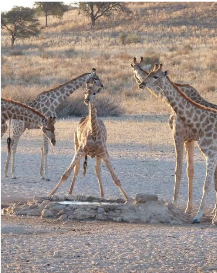
Hobater Lodge. P.N Etosha

Twyfelfontein Country Lodge . Incluido: Desayuno. Comida. Cena.