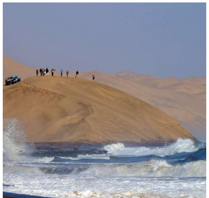
Excursión en 4x4 a Sandwich Harbour

Enclavado entre el mar y las dunas de Namib, el agua potable que se filtra del acuífero subterráneo sostiene la vegetación de agua dulce en la base de las dunas.