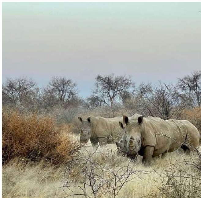
Safari en la Reserva Natural GocheGanas