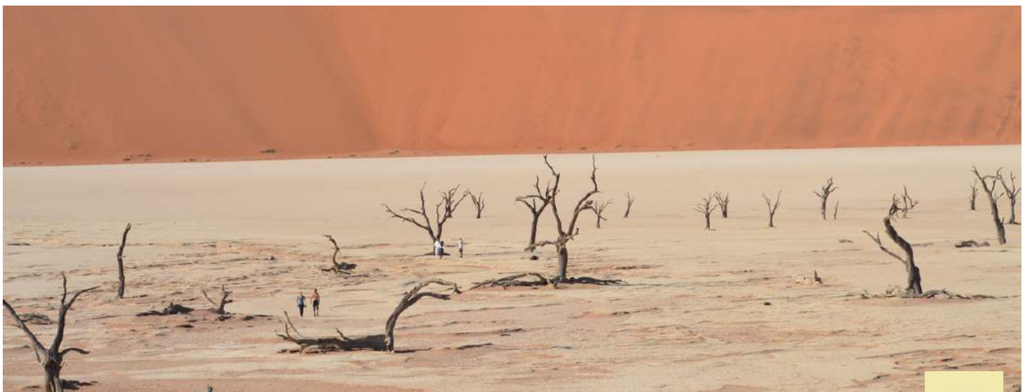
Dead Vlei . Desierto del Namib

Dead Valley Lodge o similar. Incluido: Desayuno, Comida, Cena.