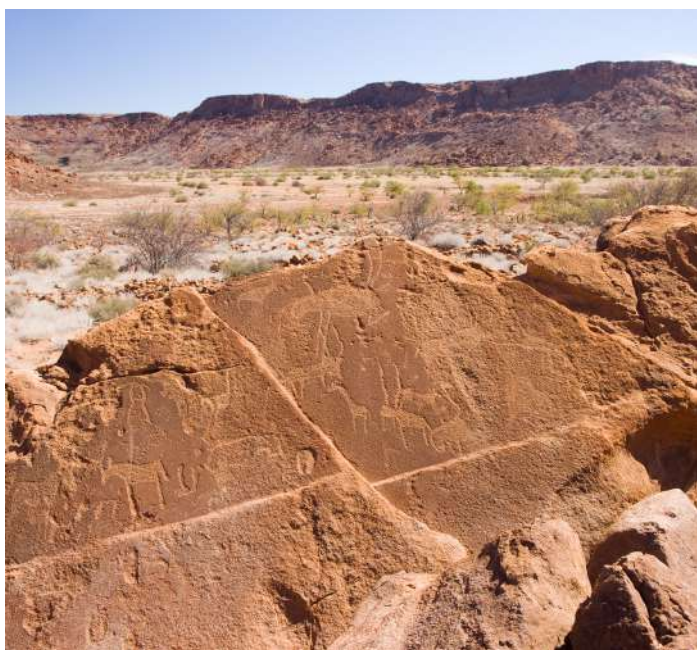
Visita a Twefelfontein

Por la mañana temprano nos dirigimos hacia el hermoso pueblo de Walvis Bay y desde el Waterfront, saldremos en catamarán para hacer un recorrido educativo en el área de la bahía en busca de los 5 grandes marinos: ballenas, delfines, pez luna, tortugas y focas.