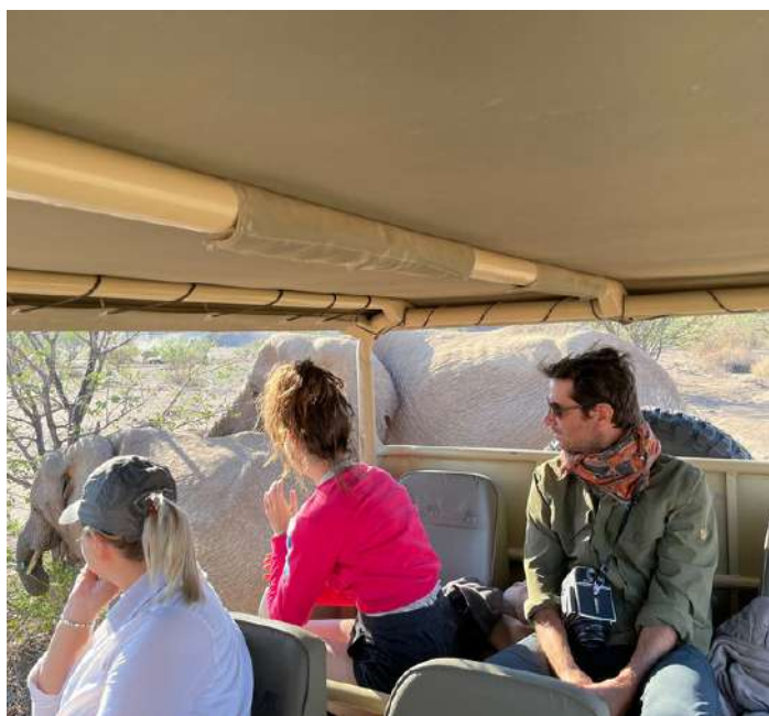
Safari en busca de los elefantes del desierto