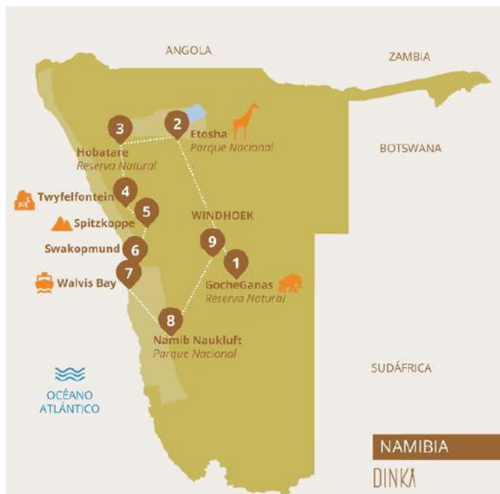
Mapa de Ruta

Hemos seleccionado actividades y alojamientos exclusivos que sólo se consiguen para grupos íntimos, y que nos llevarán a explorar enclaves que no encontrarás en los catálogos de viajes convencionales. Además, siguiendo nuestro compromiso con dejar una huella positiva, los alojamientos seleccionados son exclusivos Lodges con un alto compromiso en conservación y sostenibilidad.